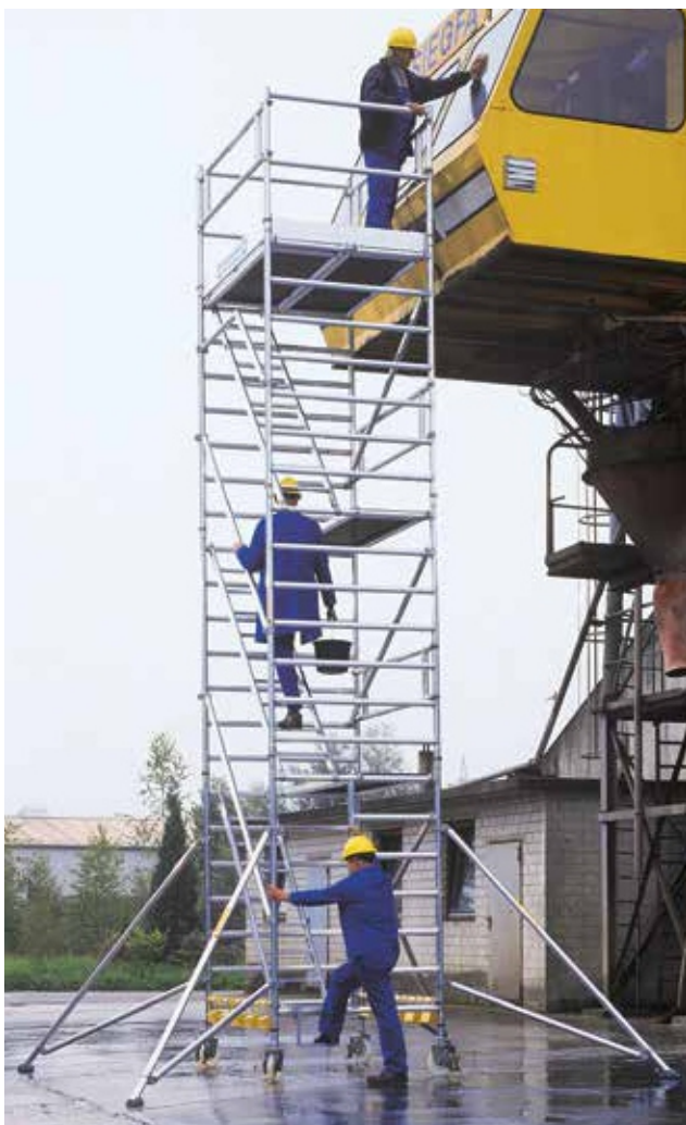
Артикул № 167300 с балластными весами артикул № 27912.